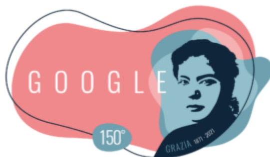
La seconda veste grafica del doodle deleddiano

C'è una Deledda che ancora non si conosce, e che emerge nei suoi scritti meno conosciuti o nella sua storia. Il secondo aspetto sottolinea come i suoi scritti parlano ai giovani di oggi e che hanno tematiche ancora attualissime, perché Grazia Deledda è "una donna dei nostri tempi".