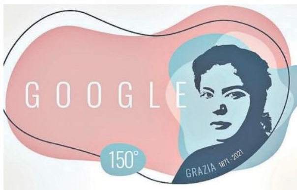
La proposta grafica per il Doodle inviata dalla Provincia a Google

Con il passare del tempo, la richiesta di doodle a livello internazionale è cresciuta. Oggi la creazione dei doodle